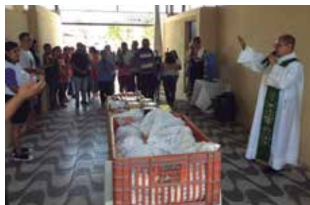
Paróquia Santo Antônio - Guaratinguetá