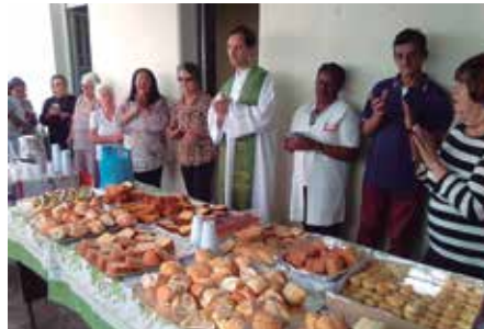
Paróquia do Puríssimo Coração de Maria - Guaratinguetá