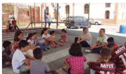
Paróquia Sant’Ana - Roseira