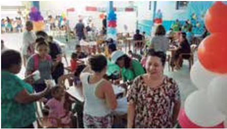
Abraço do Pai - Paróquia São Miguel Arcanjo - Guaratinguetá

Na Paróquia Puríssimo Coração de Maria foi celebrada missa às 8h30, na comunidade Santa Luzia, no Campinho, e, logo após, foi servido café da manhã para a população carente. E, na sede da Irmandade de São Benedito, foi servido almoço aos moradores de rua, idosos do Lar São José, Vicentinos e pessoas carentes atendidas pela Obra Social.