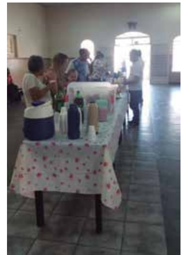
Paróquia São Francisco - Guaratinguetá