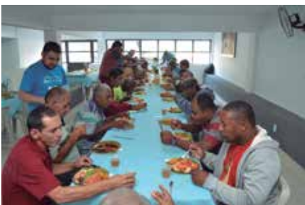
Paróquia Nossa Senhora da Glória - Guaratinguetá