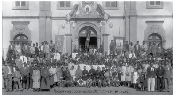
Romaria Maria da Fé 1934