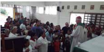
Comunidade Perpétuo Socorro - Aparecida