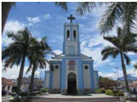
Matriz Senhor Bom Jesus

Na cidade de Potim, a festa do padroeiro do município acontece de 28 de julho a 06 de agosto, com Celebrações Eucarísticas todos os dias às 19h30 e este ano o tema central é: "Fica conosco, Senhor Bom Jesus" . (Lc 24, 13-33). Este ano diversas atrações devem acontecer durante a festa, como o 1º festival da Tainha no dia 28/07. No dia da festa (06/08) haverá Missa às 7h e às 10h; e às 19h a Grandiosa Procissão, encerrando com a Santa Missa às 19h30.