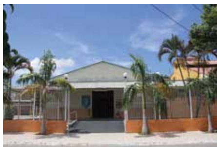
Matriz Santo Afonso

dador dos Missionários Redentoristas com celebrações todos os dias às 19h30. Para 2017, o tema a ser refletido será: "Santo Afonso e as Glórias de Maria" . No dia 13/08, dia da festa, haverá o tradicional churrasco com espetão no pátio da Igreja, a partir das 11h. Os ingressos custam R$20 e podem ser adquiridos na secretaria da paróquia. A Missa Solene será às 19h30 e, em seguida, a procissão.