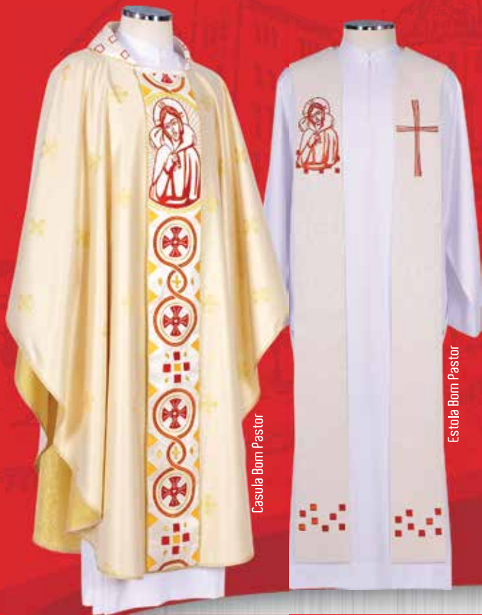
Casula Bom Pastor