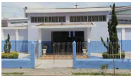
Matriz São Roque

A Paróquia de São Roque também celebra seu padroeiro de 11 a 20 de agosto, meditando o tema: "Com a Mãe Aparecida e São Roque, testemunhamos Jesus" .