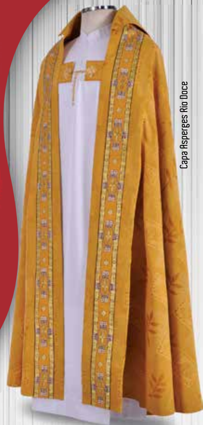
Capa Asperges Rico Doce

CIDADE DO ROMEIRO [PRÓXIMO AO HOTEL RAINHA DO BRASIL] RUA ISAAC FERREIRA ENCARNAÇÃO, 501 - JARDIM PARAÍBA - APARECIDA/SP - 12 570-000 WWW.CORDIS.COM.BR/APARECIDA | APARECIDA@CORDIS.COM.BR | TEL.: 12 3104-3980