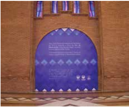
Porta Santa Santuário Nacional

Na Arquidiocese de Aparecida a abertura do Ano Santo da Misericórdia, convocado pelo Papa Francisco, e das "Portas Santas" serão realizadas, em dois momentos: no dia 13 de dezembro, às 8h, no Santuário Nacional; e às 18h, na Igreja de Santo Antônio, em Guaratinguetá.