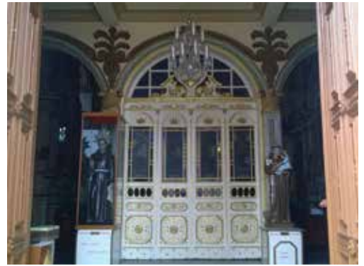
Porta Santa Santo Antônio

Para a celebração das 18h, na igreja de Santo Antônio, todas as paróquias foram convidadas a participar para que o início do Ano Santo seja marcado por um bonito testemunho de comunhão de nossa Igreja Local.