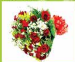
Buquê de Rosas