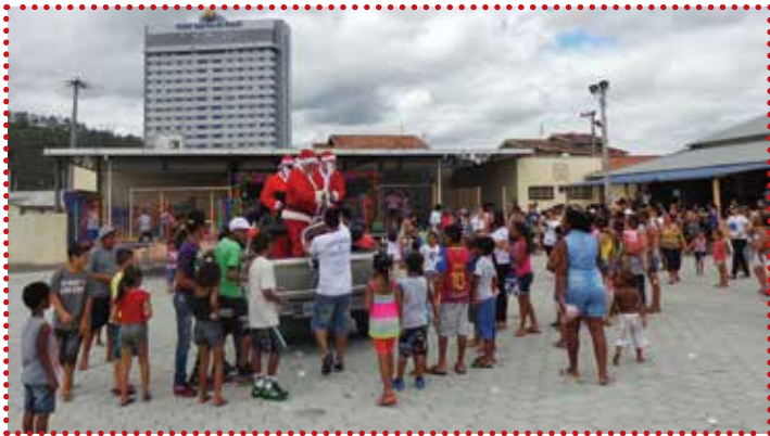
Festa das crianças - Paróquia Santo Afonso - Aparecida