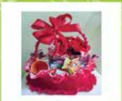
Cesta de Café