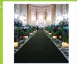
Decoração de Casamento