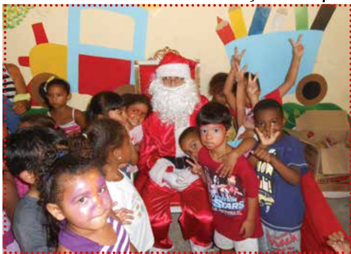
Festa Paróquia São Pedro - Guaratinguetá