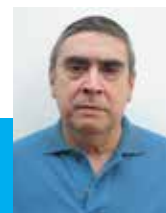
Acacio Vieira de Carvalho Escola Bíblica “São João Paulo II”

Os Inocentes de Belém morreram contra a vontade de seus pais, que desesperadamente choraram a matança de seus filhos ordenada pela tirania de um rei. As crianças vítimas de aborto nem sempre contam com o lamento de seus pais na hora da morte. Aqueles que mais deviam amá-las são os que procuram sua morte. Portanto, rezemos aos Santos Mártires Inocentes, para que intercedam ao Deus de bondade por aqueles pais e mães que hoje, sem necessidade da ordem de um rei, voluntariamente procuram o aborto de seus filhos.