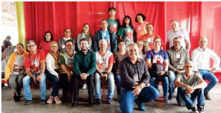
Arquidiocese de Aparecida