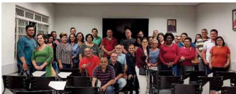
Conselho do Mesc e Avaliação - CAP - 29/11/2022

Finalizando o planejado para o ano de 2022, realizamos no dia 20 de novembro, das 8h às 17h, o Retiro com a Forania Frei Galvão, que aconteceu na Paróquia Nossa Senhora de Lourdes. E no dia 29 de novembro, no CAP, reunimos o Conselho para uma avaliação e confraternização