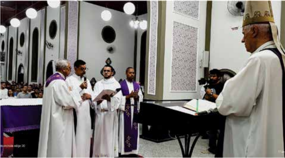
Matriz do Senhor Bom Jesus - Potim - 17/12/22