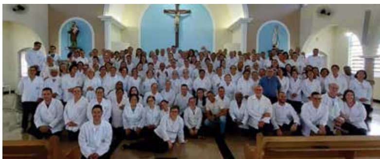
Retiro Mesc/Forania Frei Galvão - Paróquia N. Sra. de Lourdes - 20/11/2022