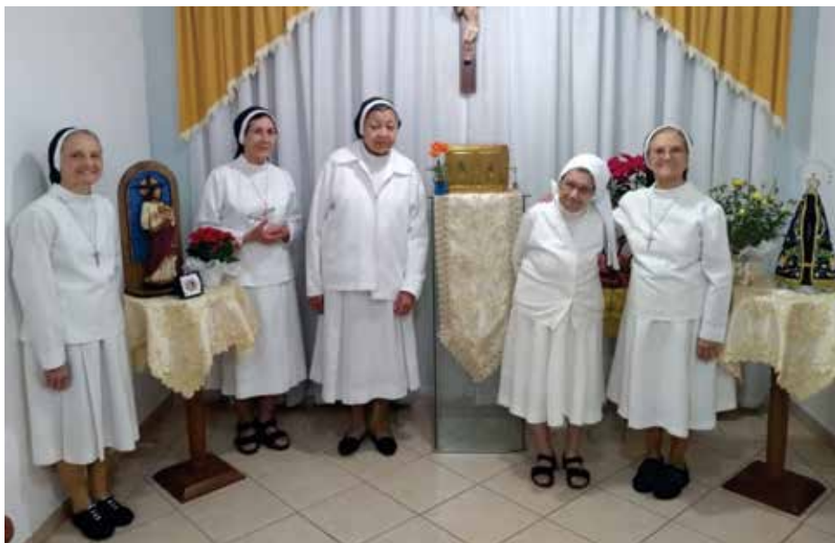
Comunidade das Irmãs Apóstolas do Sagrado Coração de Jesus - Aparecida