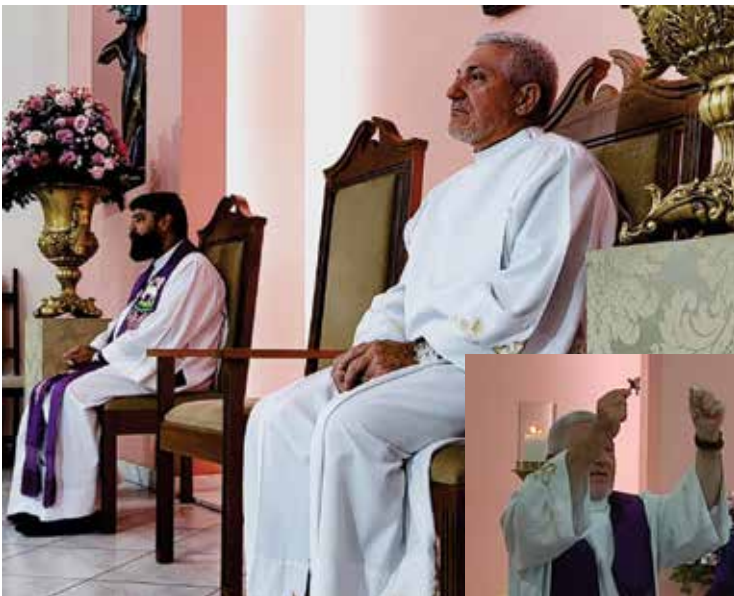
Matriz de N. Sra. da Glória Guaratinguetá - 18/12/22