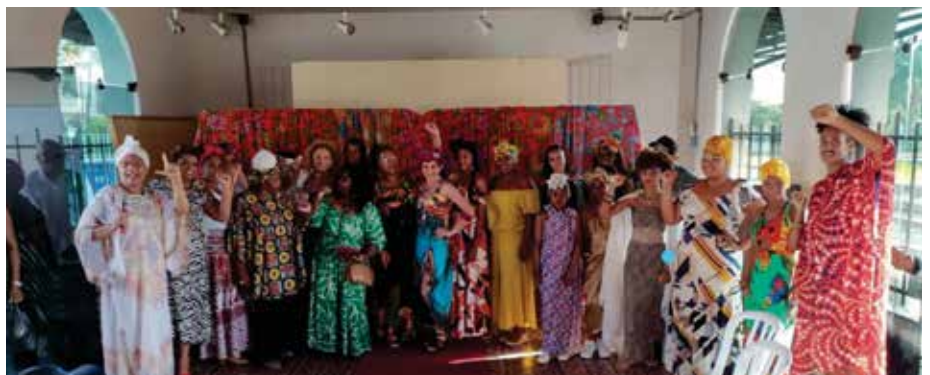
Grupo Namíbia - Aparecida