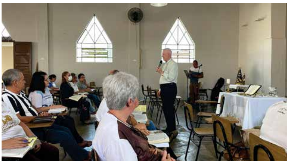
Leitura Orante da Bíblia - local: Par. Nossa Senhora de Lourdes (Forania Santo Antonio de Sant'Anna Galvão) - 14/5/2022

A leitura Orante da Bíblia deve incendiar o coração do Orante e motivá-lo para a ação apostólica, para a missão, para a evangelização. A Palavra de Deus nos impele à caridade e à ação social, como: atenção aos pobres, acolhimento das pessoas, perdão às ofensas, partilha do pão, solidariedade. Pela prática da Leitura Orante, todos se colocam à disposição para trabalhar nas pastorais, nas comunidades, no dízimo, na catequese, assumindo os grupos de reflexão, a visitação nas casas, etc. Quem medita as Escrituras encontra Cristo, sua Igreja e seu Reino; cresce na dimensão profética e social da fé, assumindo responsabilidades e trabalhos na comunidade e na sociedade. A Leitura Orante move o coração e abre os olhos para o irmão, para os necessitados, para a comunidade, para a implantação do Reino de Deus.