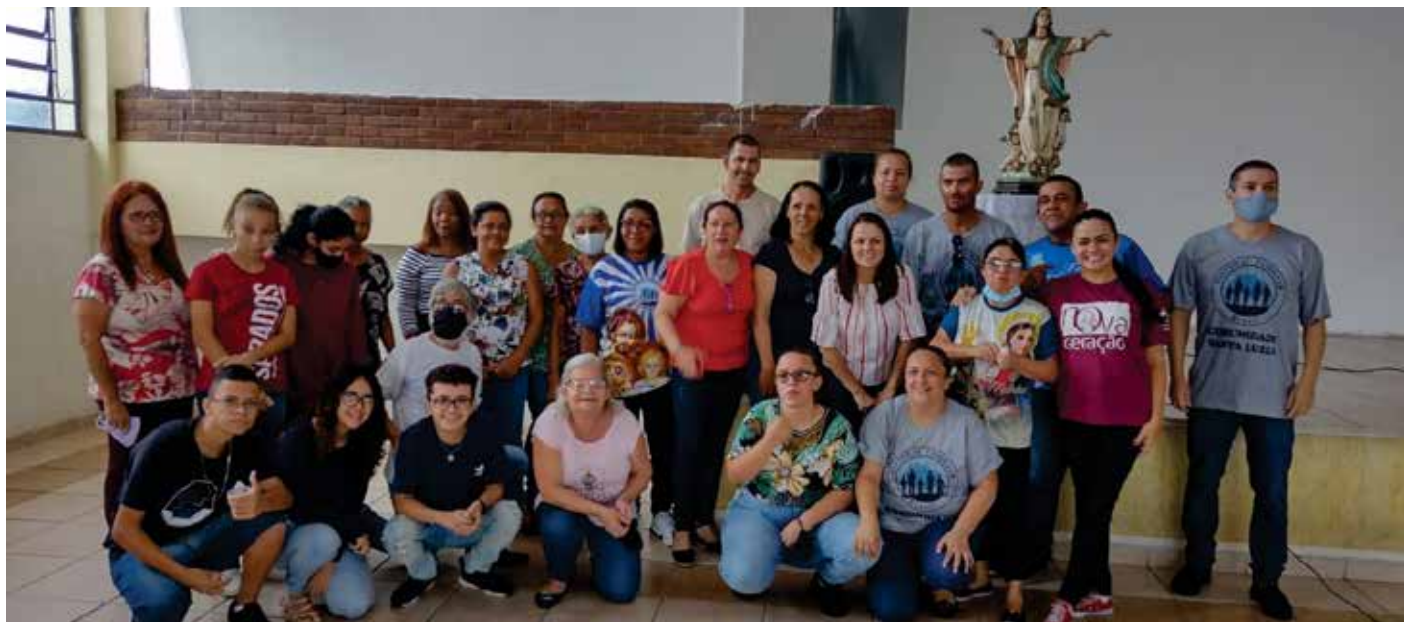
Leitura Orante da Bíblia - local: Par. Nossa Senhora da Glória - (Forania São João Maria Vianney) - 02/04/2022