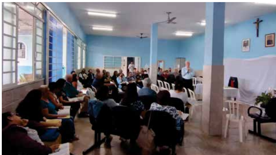
Leitura Orante da Bíblia - local: Par. São Miguel - (Forania Santo Antonio) - 07/05/2022

Cristo: Tudo na Bíblia converge para Jesus, Ele é a chave de compreensão e interpretação das Escrituras. Jesus é a última e definitiva revelação de Deus. “Ignorar as Escrituras é ignorar a Jesus Cristo”. A Leitura Orante é uma escola bíblica para sermos discípulos missionários de Jesus.