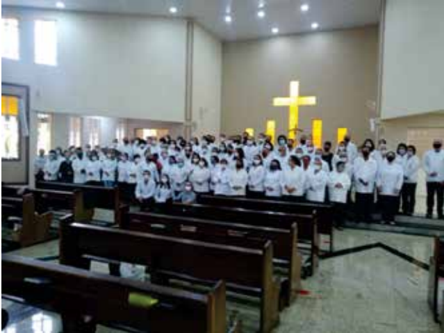
Mesc da Forania São João Maria Vianney - Matriz de São Francisco de Assis, Guaratinguetá - 31/10/2021