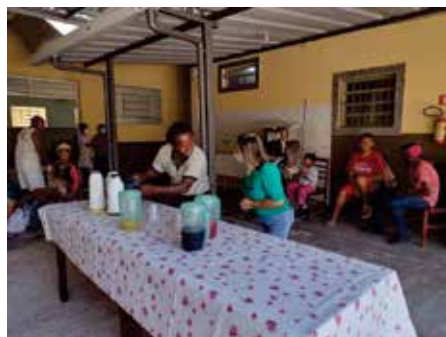
Paróquia São Francisco de Assis Guaratinguetá- 14/11