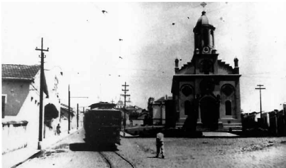
Igreja de São Benedito - 1927