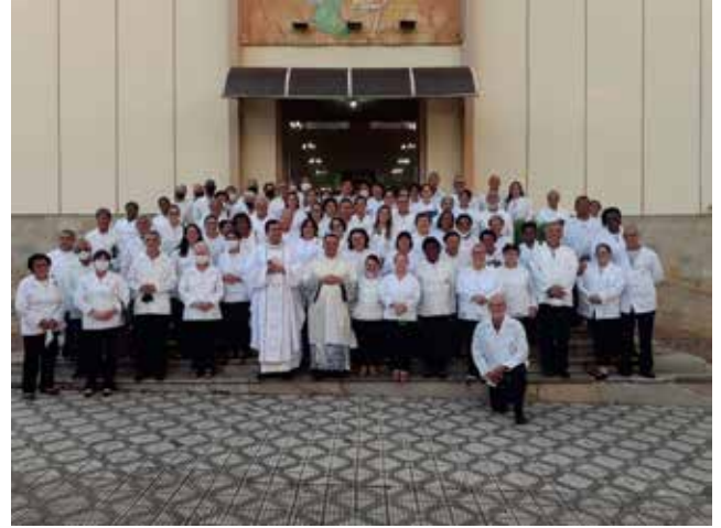
Mesc da Forania Santo Antonio - Matriz do Puríssimo Coração de Maria, Guaratinguetá - 07/11/2021 - Guaratinguetá

Está acontecendo em nossa Arquidiocese de Aparecida a espiritualidade dos Ministros Extraordinários da Sagrada Comunhão. Estamos, a partir deste ano, com uma nova proposta, de realizar por Forania. A primeira a ser contemplada foi a de São João Maria Vianney, composta pelas seguintes paróquias: Paróquia São Francisco de Assis, Nossa Senhora da Glória, Santa Luzia, São Dimas e Nossa Senhora das Graças. Aconteceu dia 31 de outubro, na paróquia São Francisco de Assis.