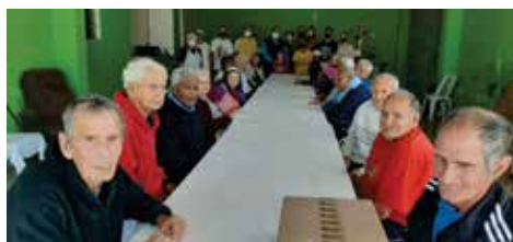
Paróquia Nossa Senhora da Conceição Lagoinha – 13/11