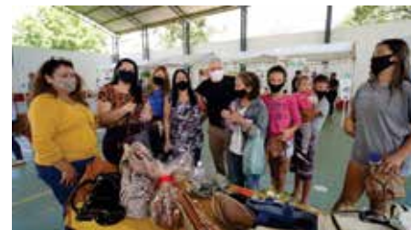
Paróquia Senhor Bom Jesus Potim - 14/11