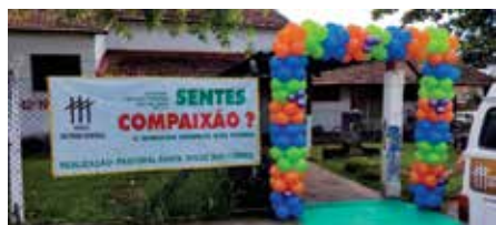
“Sentes compaixão” Paróquia São Pedro Apóstolo Guaratinguetá – 13/11