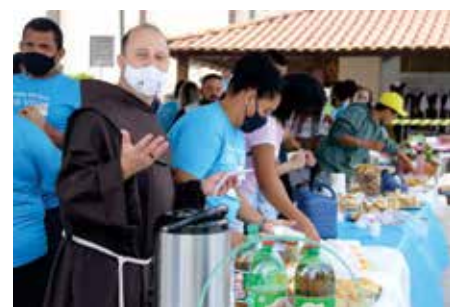
Paróquia Nossa Senhora da Glória e Santuário Frei Galvão 14/11