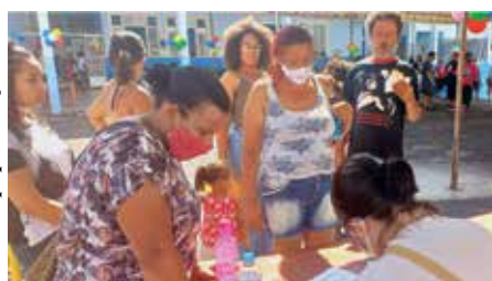
“Abraço do Pai” – Paróquia São Miguel – Guaratinguetá- 07/11