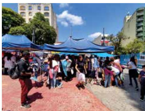
Paróquias: Nossa Senhora Aparecida e São Benedito, São Roque e Santo Afonso Aparecida- 14/11